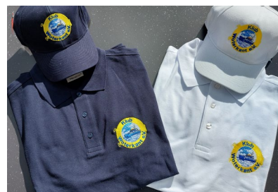
Weiße und blaue Poloshirts und Cap`s mit dem Klub Logo

Wir haben die Poloshirts und Caps in einer kleinen Stickerei in Lübeck fertigen lassen, wo auch einige Polizeien der Länder, Betriebsgruppen, Vereine und Klub`s ihre Artikel bestellen und herstellen lassen! Die Poloshirts und Caps sind von einer sehr guten Qualität!