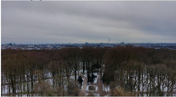
Blick von der Plattform des Planetariums über die Stadt

untersucht. Das ist wichtig, um die Astronauten für weitere Missionen noch besser vorbereiten zu können. Vielleicht hat der eine oder andere nach dieser Vorstellung seinen innigen Wunsch, Astronaut zu werden, aufgegeben.