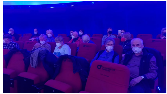
Unsere Mitglieder sitzen in sehr bequemen Liegesesseln im Planetarium

Trotz heftigen Schneetreibens in der Nacht haben sich am 31.03.2022 32 Kameradinnen und Kameraden auf den Weg gemacht, um die zwischenzeitlichen Entwicklungen selbst zu bestaunen.