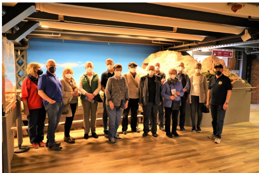
Die Besucherguppe von Klub Woterkant e.V.

Bei schönstem Wetter trafen sich die Teilnehmer so rechtzeitig vor Ort, dass noch Zeit für ein „Käffchen“ war